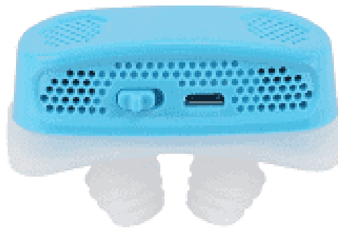
Figura 2 - Mini cpap com motor injetor de ar insuficiente