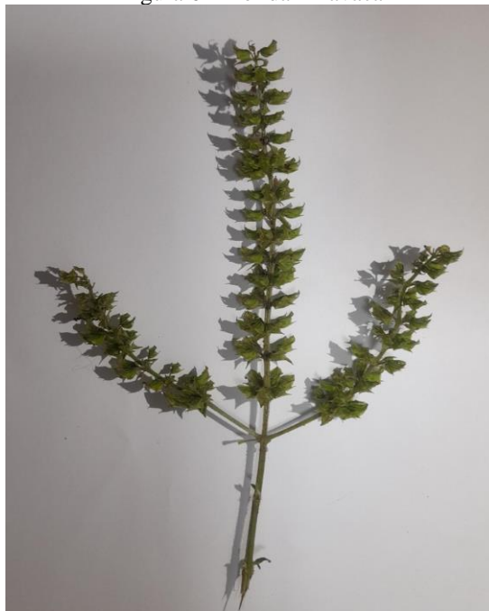
Figura 6 - Flor da Alfavaca