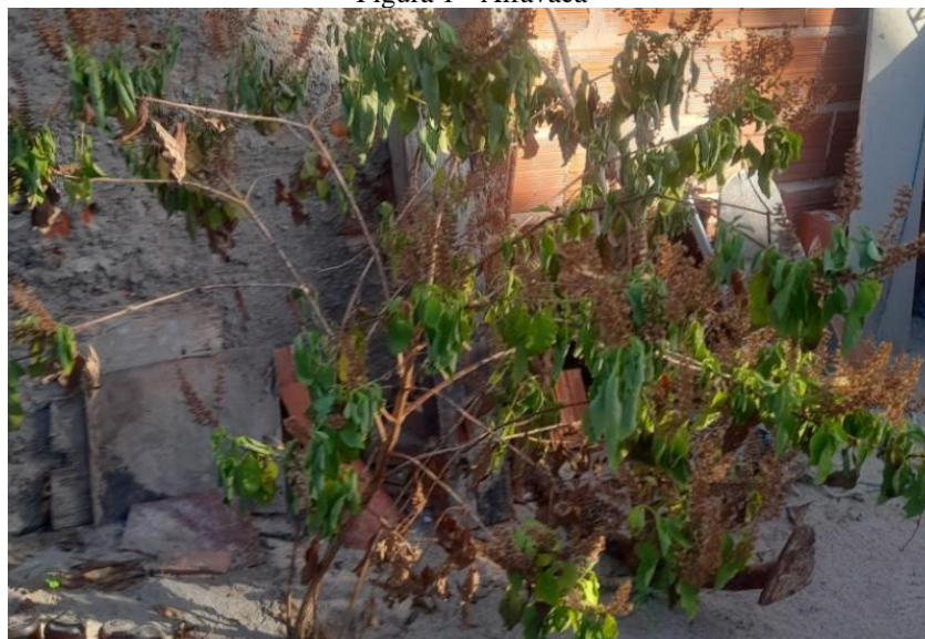
Figura 1 - Alfavaca