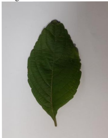
Figura 5 - Folha da Alfavaca