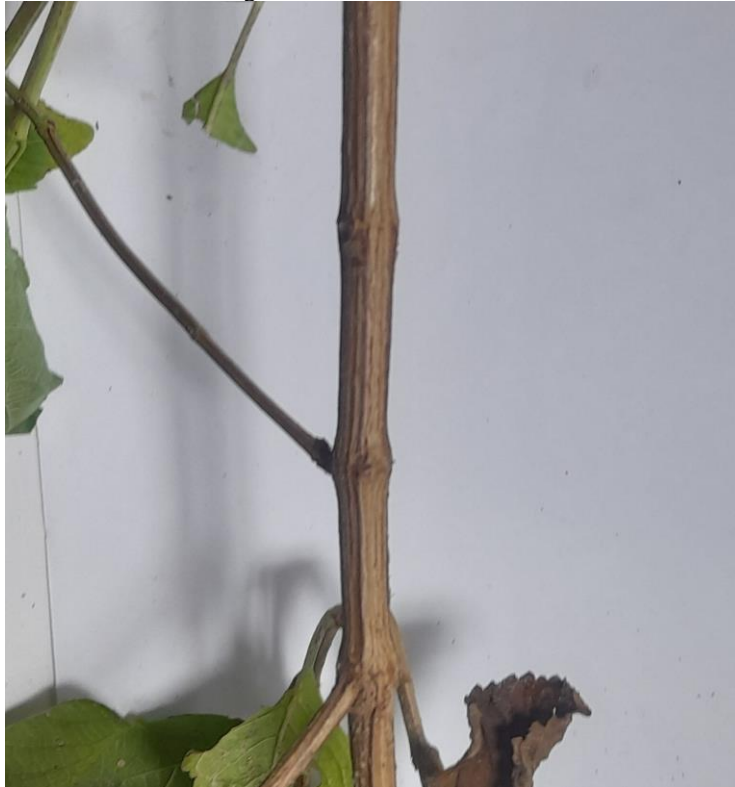
Figura 4 - Caule da Alfavaca