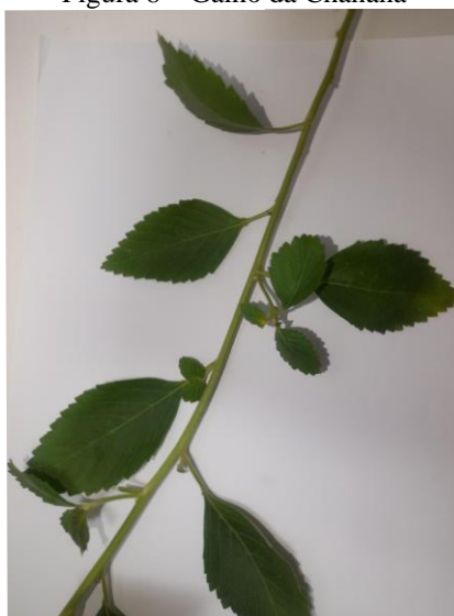
Figura 8 – Galho da Chanana

A planta é um arbusto de fácil cultivo, no qual sobrevive a altas variações de temperatura, resistindo até a 85 °C. (2)