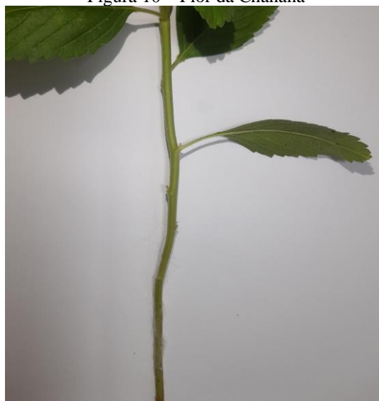
Figura 10 – Flor da Chanana