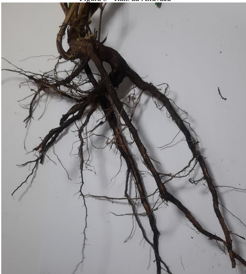
Figura 3 - Raiz da Alfavaca