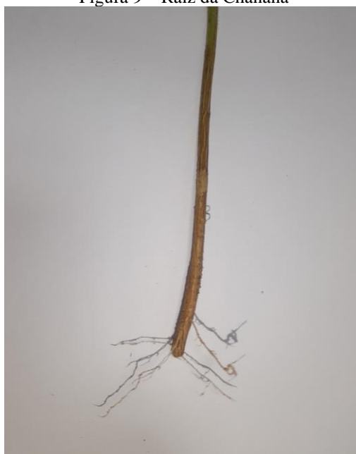
Figura 9 – Raiz da Chanana