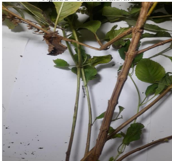
Figura 2 - Galho de Alfavaca

A Ocimum basilicum é considerada espontânea, por seu cultivo, nascimento se dá de forma espontânea, basta que as sementes sejam espalhadas pelo solo úmido e fértil para que as mesmas comecem a nascer se espalhando de forma rápida.