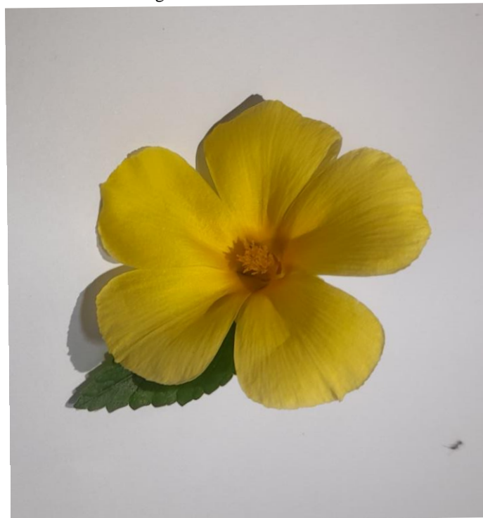
Figura 12 – Flor da Chanana