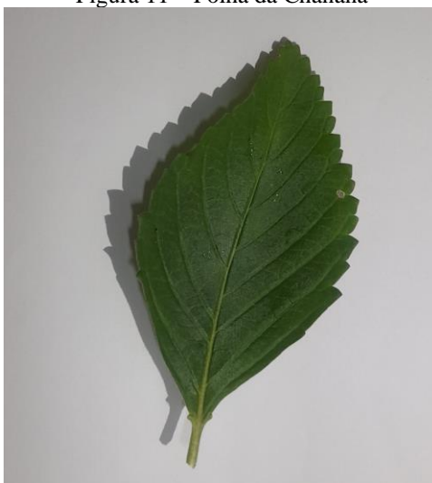
Figura 11 – Folha da Chanana

Geralmente é usado o chá, em que são utilizadas as folhas dessa planta. Onde o chá é feito com 2 folhas de Damiana em 200 ml de água fervente e deixar em volta de 10 minutos. Em seguida, coar e beber. É indicado até 2 xícaras por dia, lembrando que esse fitoterápico como qualquer outro deve ser usado sobe indicação medica, onde será mostrado os prós e outras, e saber se a pessoa pode realmente fazer uso da erva. (10)